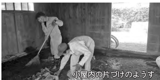
小屋内の片づけの様子

「一人ひとりの力は小さいが多量の力があつまればマンパワーとなる。この経験を元にもっと多くの人がボランティア活動に参加していけるよう声をかけていきたい」