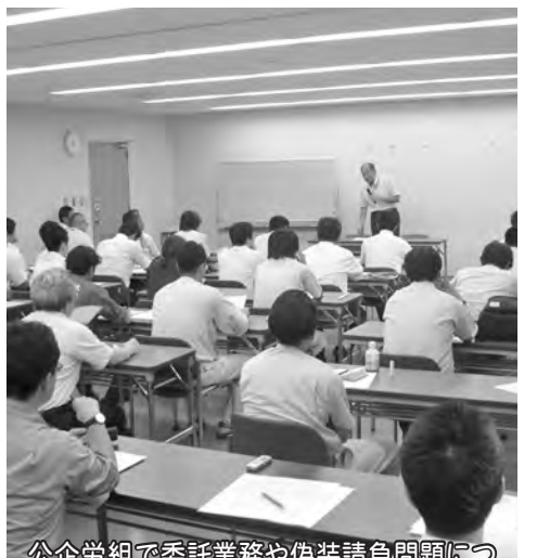
公企労組で委託業務や偽装請負問題について学習会を開催。仕事の中でも活かしていければ多くの組合員が参加しました。