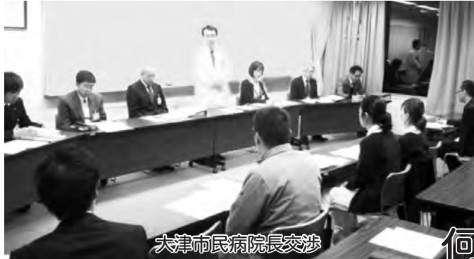
大津市民病院院長交渉

大津市では、大津市民病院の2017年4月からの独立行政法人化(独法化)に向けて準備が進められています。しかし、一般的に独立行政法人になると、経営効率を優先するあまり、スタッフの労働条件の悪化による職員不足・病棟閉鎖や、個室料金の値上がりなど利用者の負担増などにつながる事態が起っています。この間、病院労働組合と病院臨時職員労働組合では市当局に対し、「自治体病院の役割を守っていくこと」「よりよい医療を提供する」との思いのこもった「団結署名428筆」を市長あてに提出しました。当局は交渉や議会のなかで、「独立行政法人になつても、大津市立病院であることに変わりはない。不採算性医療についても必要な経費は確保・維持していく」と回答しています。