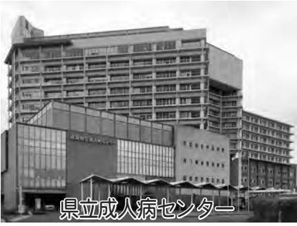
県立成人病センター

能を再構築するため、センター第二期改築工事として新病棟の整備を進めており、平成28年11月7日にオープンする予定です。高度専門医療の提供と全県型医療の展開に向けた病院機能の強化として、「無菌病棟」「疾病・介護予防センター」「臨床試験・治療センター」などの新たな機能を整備する他、「外来化学療法セ