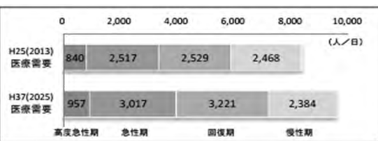
在宅医療 151%増への対応策は？