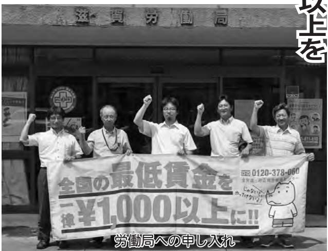
労働局への申し入れ

最低賃金は、パートやアルバイトだけでなく正規職員の給与にも大きく関係しており、その額は8月に行われる中央最低賃金審議会で示される引上げ額の目安を参考にしながら、各地方の最低賃金審議会や実情等を踏まえて10月に決定される仕組みとなっています。滋賀自治労連は国民春闘滋賀県共闘会議の一員として、政府も掲げる「時給1000円」の早期実現をめざし、滋賀労働局への意見陳述や審議会の傍聴はじめ、各駅頭での宣伝行動や中央行動などにも積極的に取り組んでいます。