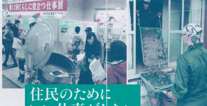
福岡県豪雨災害支援にあたる全国の仲間