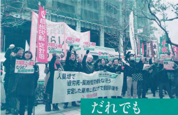
「公務・民間の仲間と力を合わせて大幅賃上げを目指す」(18春闘経団連包囲行動)