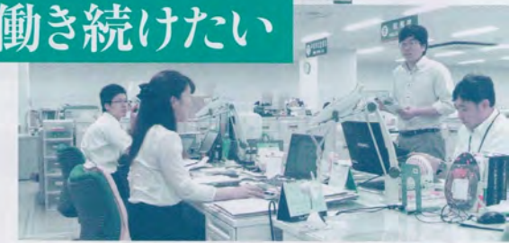
残業実態を把握するための職場訪問(茨城・筑西市職)