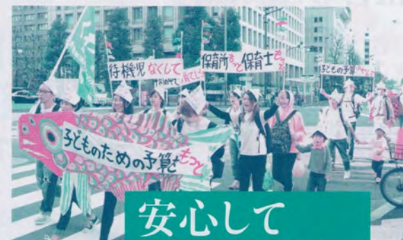
待機児なくして、子どもの予算を増やして!と訴え銀座をパレード