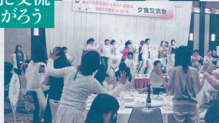
自治体にはたらく女性の 全国交流会inあいち 夕食交流会でパフォー ムス披露