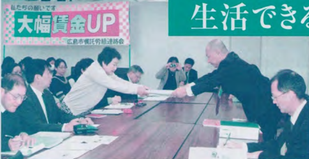
「みんなの声と願いを集めて」広島市嘱託連絡会による17賃金確定交渉