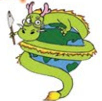
栗東市スポーツ協会職員労働組合

昨年、年頭の挨拶では、ロシアのウクライナ侵攻を嘆き平和な年になることを願いましたが、世界情勢は悪化の一途をたどりました。今年こそは平和に！！