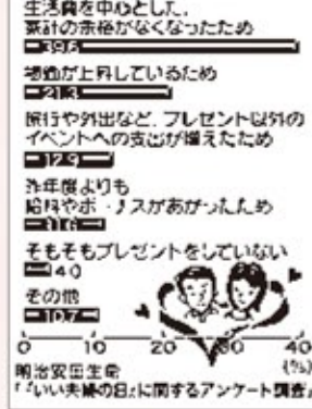
明治安田生命「『いい夫婦の日』に関するアンケート調査」