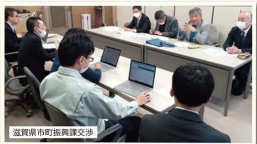
滋賀県市町振興課交渉

みなさんの職場の賃金・労働条件は、黙ってはいけません。人事院勧告に基づく給与改定差額の4月遡及支給も、会計年度任用職員の期末勤勉手当支給も、保育士配置基準の改善や子どもの看護休暇の拡充も、すべて組合要求で勝ち取ってきた成果です。公務公共で働く魅力と誇りを実感し、安心して働き続けられる職場をつくり、仕事の誇りと夢を堂々と語り合える環境を一緒につくっていきましょう。