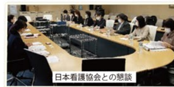
日本看護協会との懇談

医療部会では、医療従事者や介護福祉職員など専門職の大幅な増員と人材育成、老朽施設の増改築など県民の命と健康を守るための活動を行っています。また同時に、医療現場で働く仲間が安心して働き続けられる労働条件の整備や職場づくりを進めるとともに、県立病院の直営堅持なども求めて運動しています。県内だけではなく近畿や全国の仲間とも連携し、省庁要請や日本看護協会会長との懇談、白衣の行進(ナースウエーブ)などにも取り組んでいます。